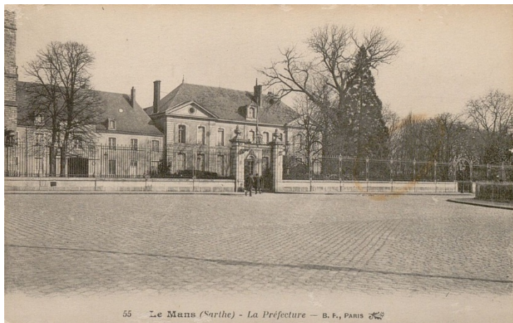
55 - Le Mans (Sarthe) - La Préfecture - B. F., PARIS

Des visites guidées et ateliers à destination du public scolaire seront organisés, autour des axes suivants : les collectivités (organisation et compétences), les missions du Département (en centrant le propos sur ce que le Département apporte dans la vie de chaque enfant : PMI, ASE, collèges, routes, culture...), ou encore le droit de vote.